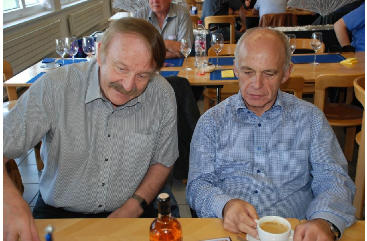
2017: Renovation der RSA für 1,1 Mio Verhandlungen mit BR Ueli Maurer