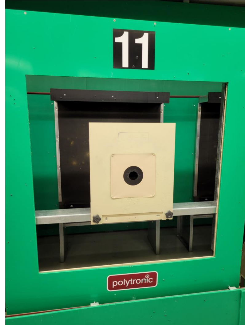
2024: 50m-Anlage mit neuer Trefferanzeige und Kleinkaliber- scheiben