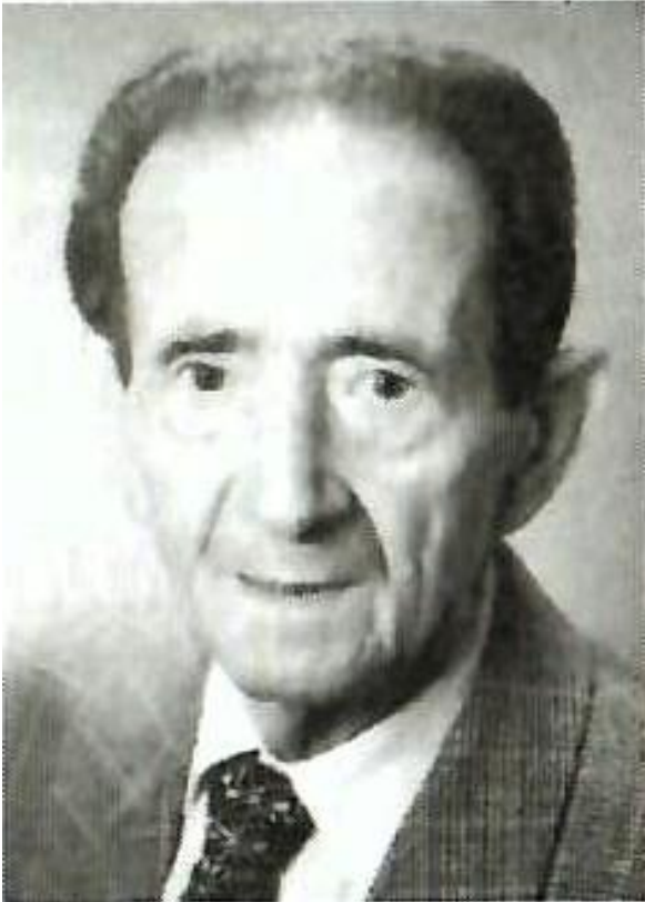
Adolf Richner, 1987