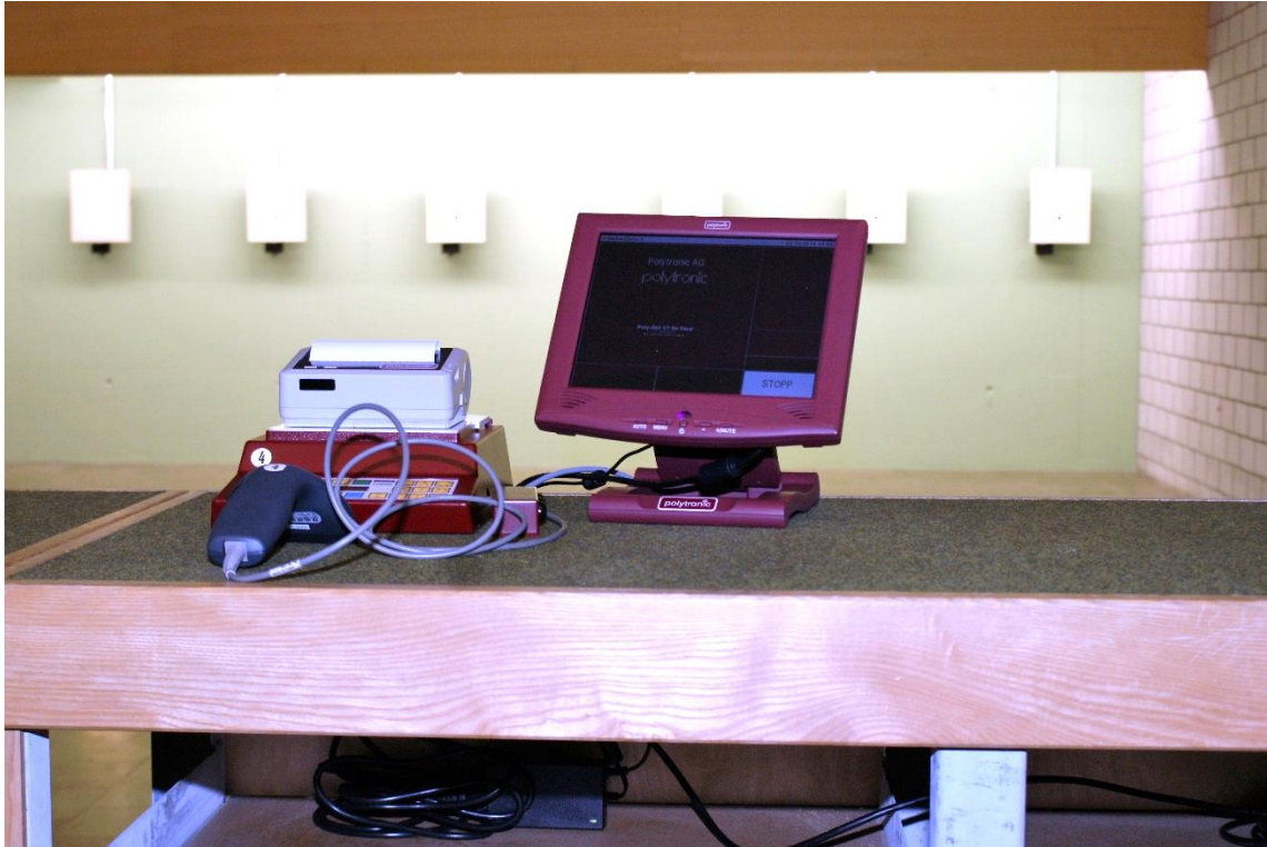
2018: 10m-Anlage mit elektronischer Trefferanzeige