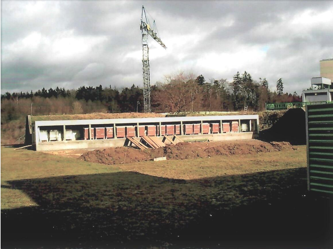
2004: Sanierung 50m-Stand